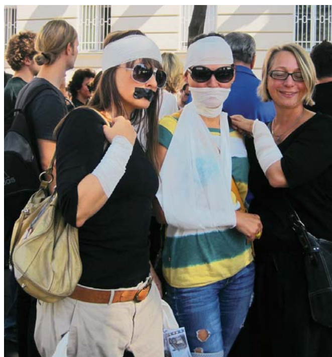
„SVA-Opfer“ auf dem Flashmob der „Amici delle SVA“.

Mittlerweile begehren viele Selbständige gegen diese Zustände auf. Besonders lautstark zu Wort gemeldet hat sich in den letzten Wochen die facebook-Gruppe „Amici delle SVA“, die im Mai gegründet wurde und mittlerweile 1.800 Mitglieder umfasst. Am 13. September fand ein Flashmob vor dem Sozialministerium statt, wo „SVA-Opfer“ gratis von Ärzten behandelt und mit Klostersuppe verköstigt wurden. Mitglieder der Gruppe sind aber auch hinter den Kulissen aktiv. Gespräche mit politisch Verantwortlichen haben bereits stattgefunden, und auch ein Anwalt hat sich bereit