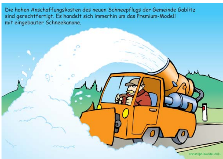
Die hohen Anschaffungskosten des neuen Schneepflugs der Gemeinde Gablitz sind gerechtfertigt. Es handelt sich immerhin um das Premium-Modell mit eingebauter Schneekanone.

Wir haben in Gablitz in Zeiten wie diesen wirklich genug andere Notwendigkeiten.