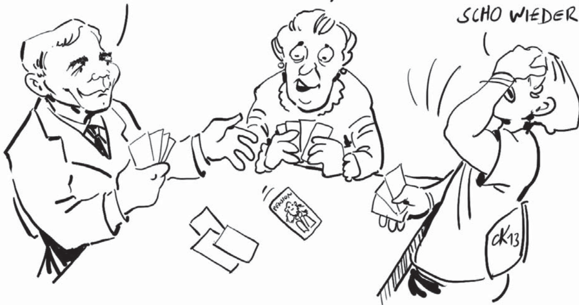
WERNER FAYMANN BEIM GENERATIONENPOKER